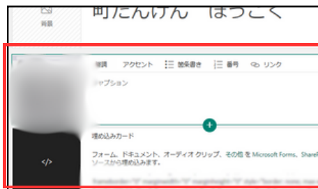
動画とFormsを挿入する。 ※Formsは埋め込み用リンクを使用