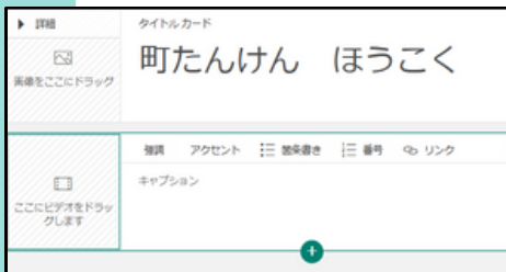
「+」→「メディア」からビデオ、埋め込みを選ぶ