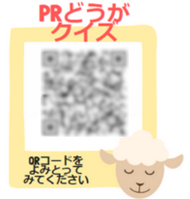
QRコードを印刷し、ポスターに貼る