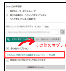
「共有」からリンクを取得する ※パスワードを設定すると◎